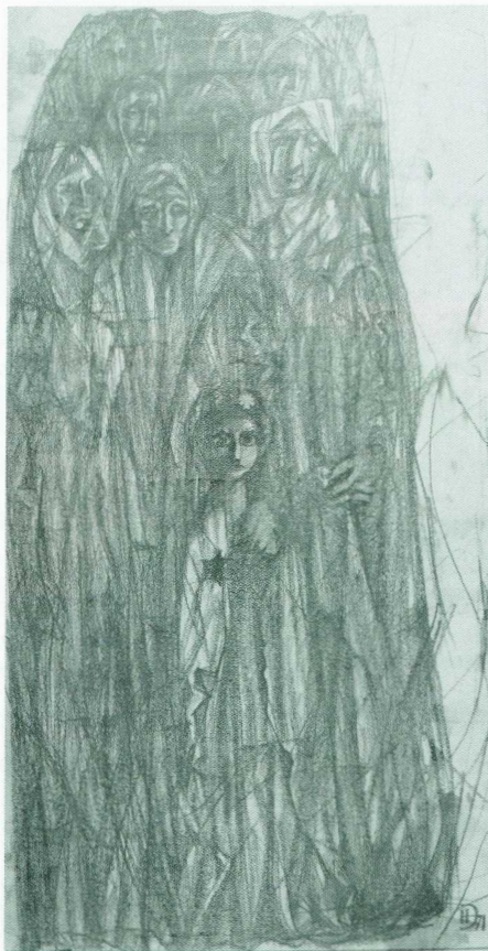
Nikolai Estis, »Menschenzug«, Blei auf Papier, 1971.

möglichte mir, innere Dramatik und Leid zu vermitteln. Tusche und Papier sind geschmeidige, demokratische Materialien, und der Weg vom Erlebnis zur Darstellung ist hier kurz: Dein Gefühlszustand kann sich auf der Fläche sofort verwirklichen.