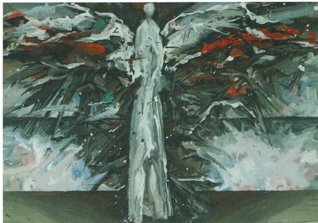
Nikolai Estis, aus dem Zyklus »Engel«, Tempera auf Papier, 1983.